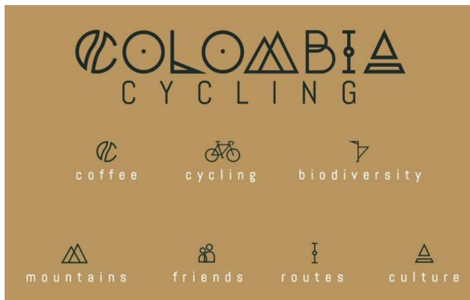
Imagen 3. Cada una de las letras que conforman la palabra Colombia tienen un significado especial para este emprendimiento.

buscaba transmitir. Fue por ello que para el 2017 se renovó, partiendo de la premisa de que cada letra que conforma la palabra Colombia tiene un significado. La C es de café, las O hacen alusión a las ruedas, la L es la biodiversidad del país, la M se refieren a las montañas, la B hace referencia a la amistad, la I tiene que ver con las rutas y la A tiene como significado cultura, historia y gastronomía.