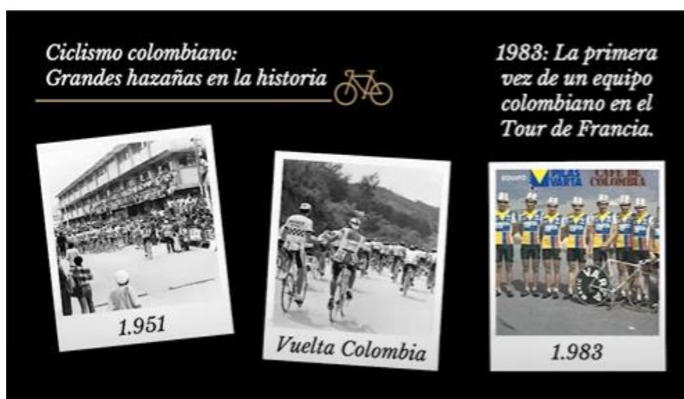
Imagen 1. Momentos históricos ha vivido el deporte colombiano gracias al ciclismo. Tomado de la conferencia Colombia Cycling: innovación a pedalazos.

el italiano Fausto Coppi, que en su palmarés ostenta cinco títulos del Giro de Italia, dos del Tour de Francia y dos a nivel mundial. Sin embargo, en aquella ocasión, Coppi, uno de los ciclistas de mayor repercusión en la historia de este deporte, no logró superar la dureza de los 42 kilómetros de ascenso y humedad del Alto de Minas 2 y junto a su equipo se vieron en la obligación de abandonar la competencia. Quien sí demostró que era posible recorrer las grandes distancias del país a través de la bicicleta fue Efraín 'Zipa' Forero, vencedor de la primera edición de este certamen. Este deportista, oriundo del municipio de Zipaquirá, además de ser el pionero del ciclismo en Colombia, fue la persona que se encargó de abrirle camino a los escarabajos 3 , que hasta el 2023 han logrado hazañas importantes para Colombia, como los títulos en las tres grandes vueltas del ciclismo: Tour de Francia (1), La Vuelta a España (1) y el Giro de Italia (3).