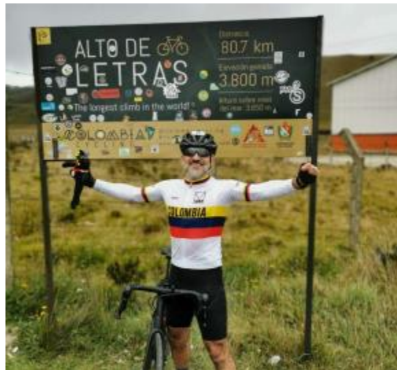
Imagen 5. Uno de los tours más retadores es el Alto de Letras.

Para Colombia Cycling lo más importante es que todas las empresas que trabajan el cicloturismo ofrezcan lo mejor del país, para que de esta manera la imagen de Colombia ante el mundo sea de alta calidad. En lo que respecta al tema de la competencia lo abordan de manera global. De hecho, las primeras investigaciones se dieron alrededor de empresas extranjeras, aunque estas no veían al país como uno de sus destinos. Sin embargo, gracias a las experiencias ofrecidas por esta empresa colombiana, que tiene en sus aliados una de sus más grandes fortalezas, esta percepción se ha ido transformando. Duvine e In Gamba, ambas empresas norteamericanas enfocadas en brindar experiencia en el cicloturismo, son las más cercanas a lo que realiza esta organización colombiana.