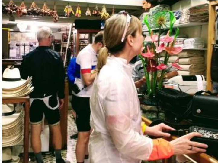
Imagen 6. Experiencias alrededor de la artesanía es uno de los valores diferenciales que tiene Colombia Cycling.

También es importante precisar que, para Colombia Cycling la sostenibilidad es importante desde los regalos, hasta evitar el consumo de plásticos. De hecho, los primeros días de cada rodada se les explica a los clientes cómo será el viaje alrededor del país, pero también se les dan recomendaciones para montar bicicletas en Colombia y sugerencias desde la filosofía de la sostenibilidad. En este caso el no utilizar pitillos si no es necesario, ni comprar botellas plásticas durante los recorridos. Para ello este emprendimiento cuenta con un recipiente grande de agua que se mantiene con hielo y electrolitos, que permite ahorrar hasta 600 botellas de agua. Acciones como estas demuestran que los pequeños cambios inspiran a hábitos que contribuyen a un planeta mejor. A todo lo que viene realizando esta compañía, se suma el proyecto de retomar la Casa Colombia Cycling, la cual cuenta con cinco habitaciones y se utiliza para hacer eventos de turismo, al igual que actividades para mostrar la experiencia de esta empresa, a través del bienestar, naturaleza y cicloturismo.