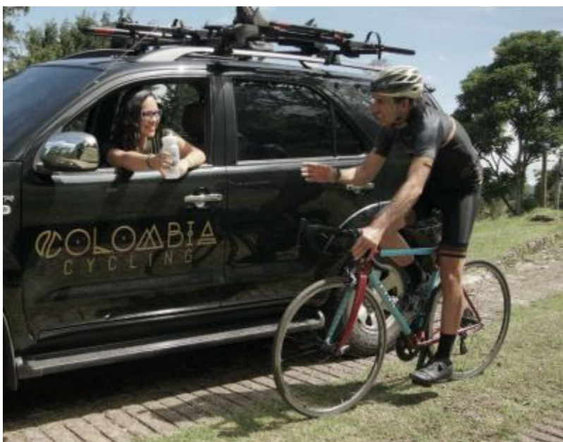
Imagen 2. Emociones, recuerdos memorables y la satisfacción de haber logrado los objetivos son algunas de las experiencias que tienen los clientes de Colombia Cycling. Tomado de la conferencia Colombia Cycling: innovación a pedalazos