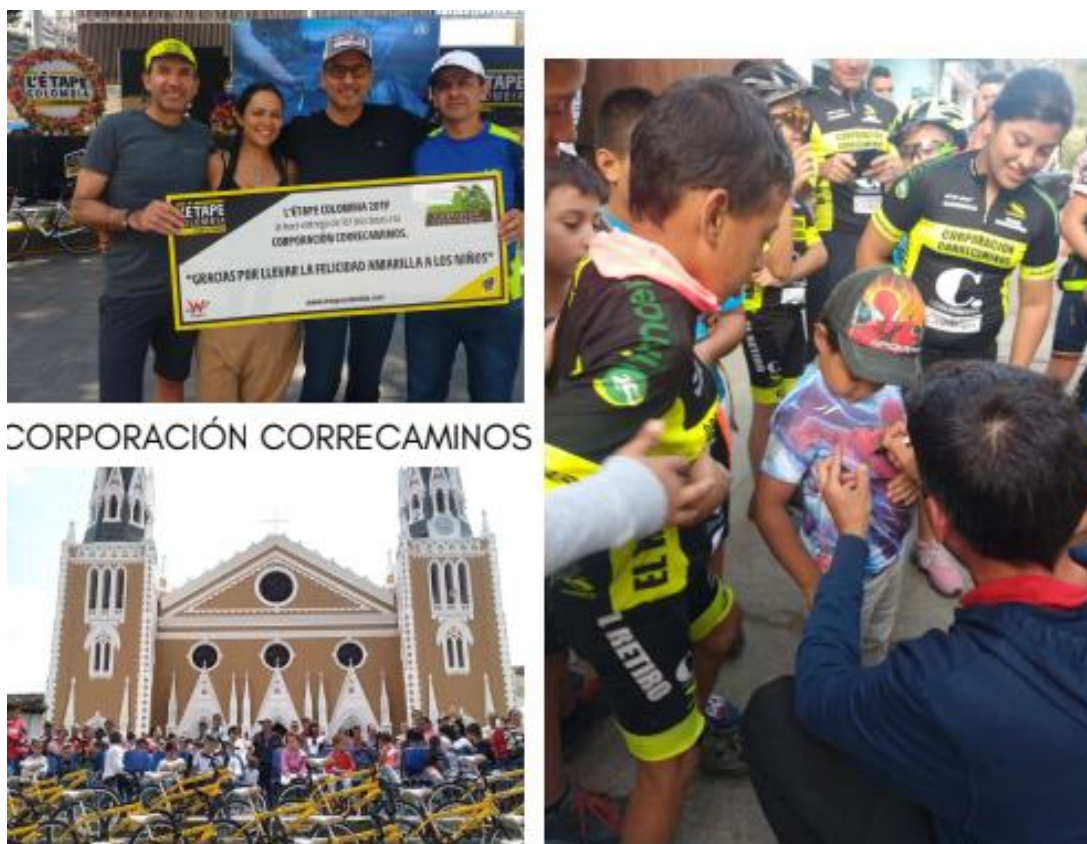
Imagen 6. A través del ciclismo, en esta compañía buscan mejorar la calidad de vida de cientos de niños en el Oriente de Antioquia. Tomado de la conferencia Colombia Cycling: innovación a pedalazos

mejorar la calidad de vida de los habitantes de dicho municipio a través del ciclismo, vinculando niños, jóvenes y sus familias. Allí se brindan charlas y programas en desarrollo mecánico, nutrición y ensamble de bicicletas. Además, se tiene una alianza con L'etape Colombia, uno de los Gran Fondos que hay en el país, en el que por las inscripciones que se hagan, se puede tener un porcentaje para invertir en bicicletas que le puedan servir a los niños del área rural a ir a la escuela.